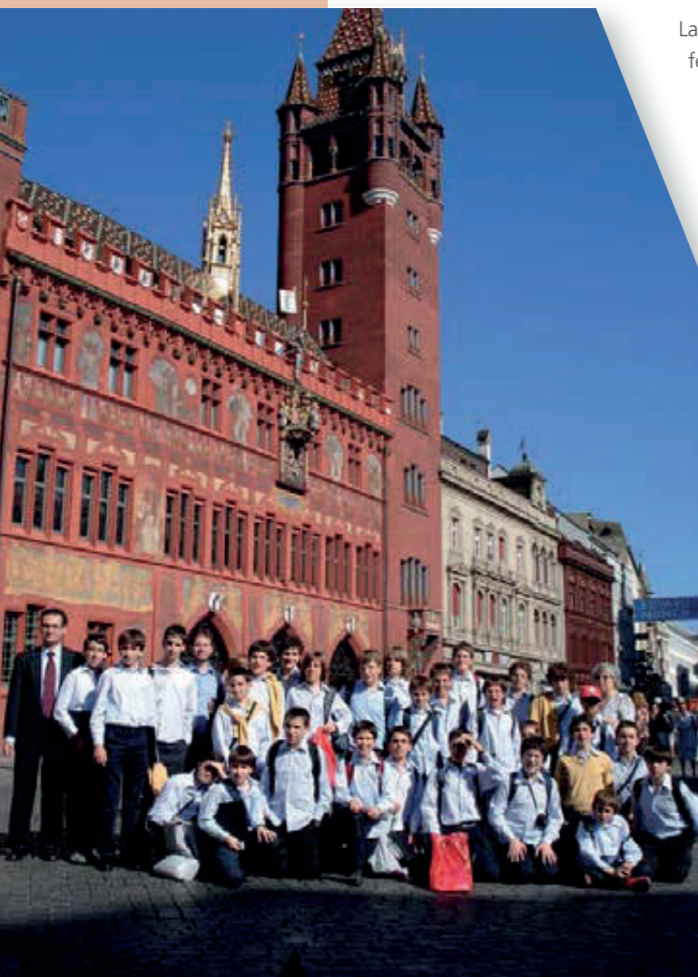
Foto de grup a la Markplatz de Basilea, davant l'Ajuntament

La tercera setmana de maig ha estat ben especial: hem participat en un festival de cors europeus a Suïssa. Una experiència molt especial: vam ser acollits per famílies dels voltants de Basilea, i vam poder sentir cors molt diferents dels nostres. Ens vam fer molt amics d'un cor de polonesos... i poloneses!! I vam poder comprovar la puntualitat dels suïssos, així com la seva amabilitat i eficàcia.