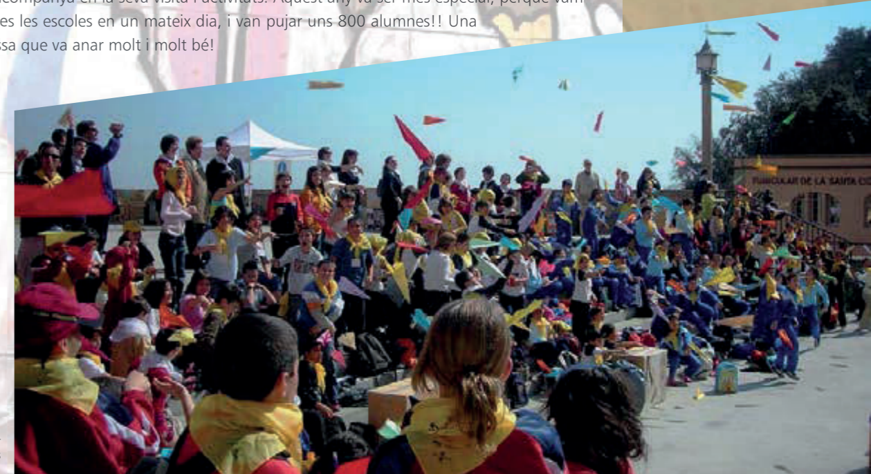
L'espai Gresca va ser dels més celebrats