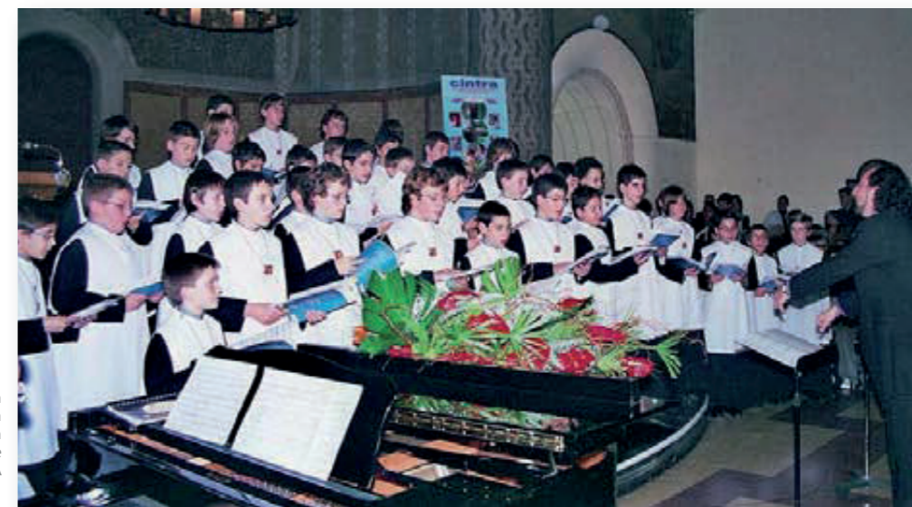
Els escolans porten penjada al coll una ceràmica que els van regalar els nois de CINTRA