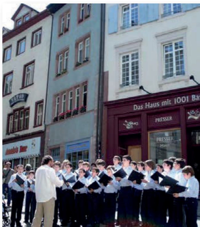
Una tarda del Festival els cors van oferir els seus cants en diversos punts de Basilea