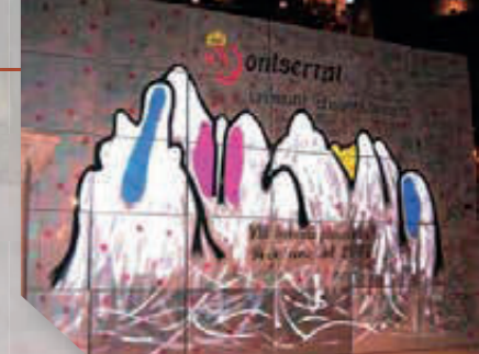
Cada escola va decorar una caixa que va formar un gran mural a la Basílica

Projecte què? Projecte telemàtic «Montserrat, un munt d'aventures». Ja fa 8 anys els escolans tutoritzen aquest projecte dirigit a diverses escoles de Catalunya, i organitzat per la Fundació Escola Cristiana i l'Escolania. Cada escolà de secundària té assignada una classe d'una escola catalana: a través d'Internet, l'escolà guia els altres alumnes en aquest projecte que té per tema Montserrat. I a la primavera hi ha la trobada presencial a Montserrat: l'escolà acull l'escola, i els acompanya en la seva visita i activitats. Aquest any va ser més especial, perquè vam ajuntar totes les escoles en un mateix dia, i van pujar uns 800 alumnes!! Una gran festassa que va anar molt i molt bé!