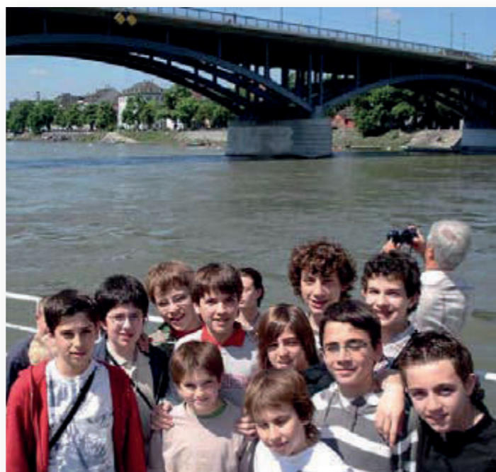
Unes hores amb vaixell pel Rin, fins al lloc on s'encreuen Suïssa, França i Alemanya