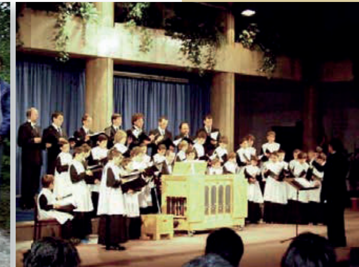
Concert a Veszprém