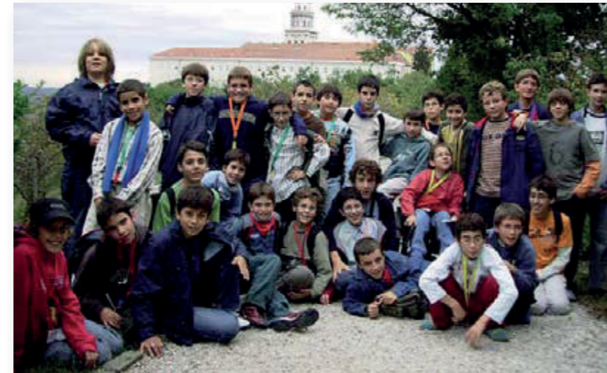
Visita a Pannonhalma, un monestir benedictí com Montserrat