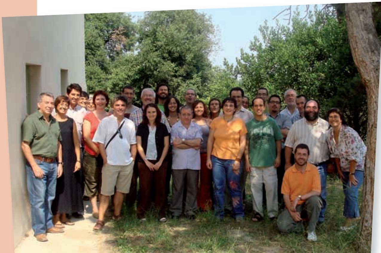
L'equip de professors, educadors i administració en la jornada de principi de curs a Can Martorell (Montserrat)

El segon número de la Revista de l'Escolania arriba en aquest final de trimestre nadalenc, recollint les activitats més importants dels darrers mesos. L'objectiu amb el qual començarem el curs només podia ser un: millorar. Mirar endavant sense perdre el sentit del que fem. Avançar per a treballar més coordinadament i més a gust, superar-nos per a introduir modernitat a l'Escolania,