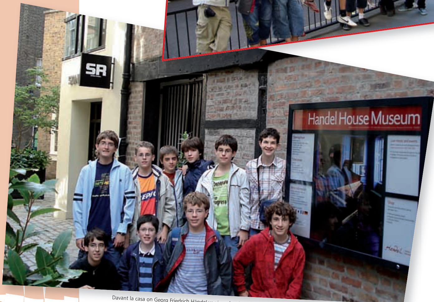
Davant la casa on Georg Friedrich Händel va viure des del 1723 fins la seva mort l'any 1759. Aquí va escriure "El Messies"!