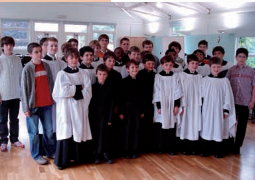
Amb els nois del cor de l'escola benedictina d'Ealing, que ens van acollir.

Com a final d'estada a l'Escolania, els escolans grans vam anar a Anglaterra, i vam ser acollits pels nois d'una escola benedictina de Londres: Saint Benedict's.