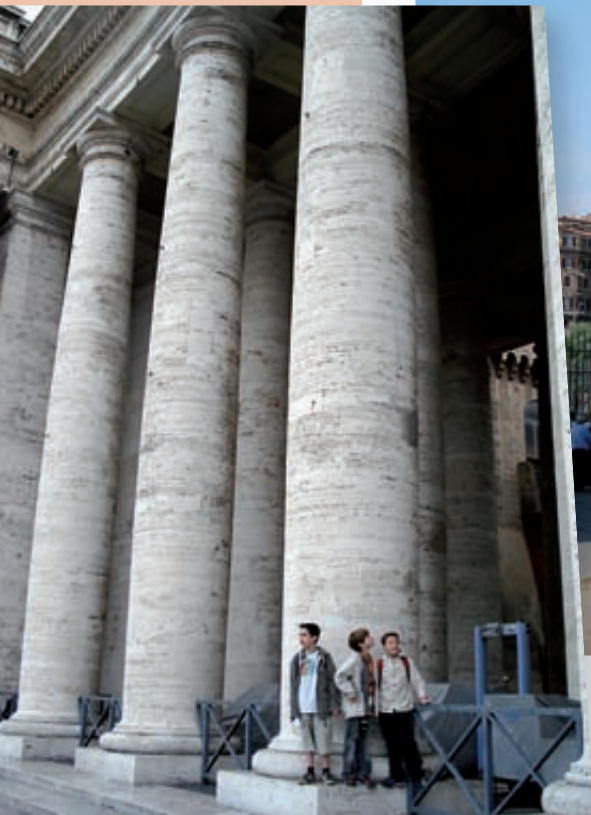
A la columnata de la plaça de Sant Pere del Vaticà.