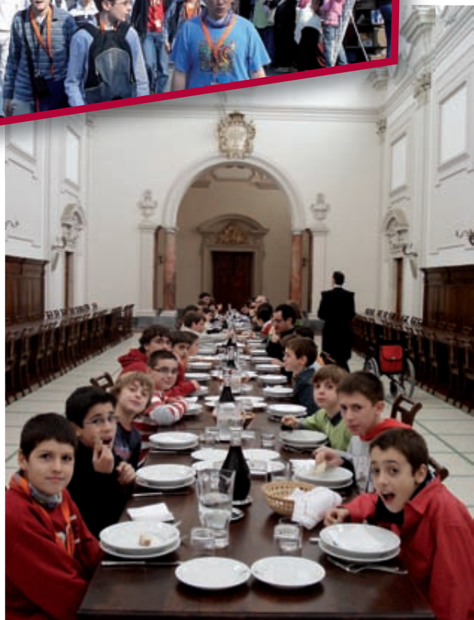
Al menjador de l'Abadia de Montecassino.