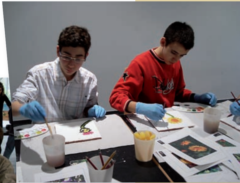
Taller de pintura al fresc