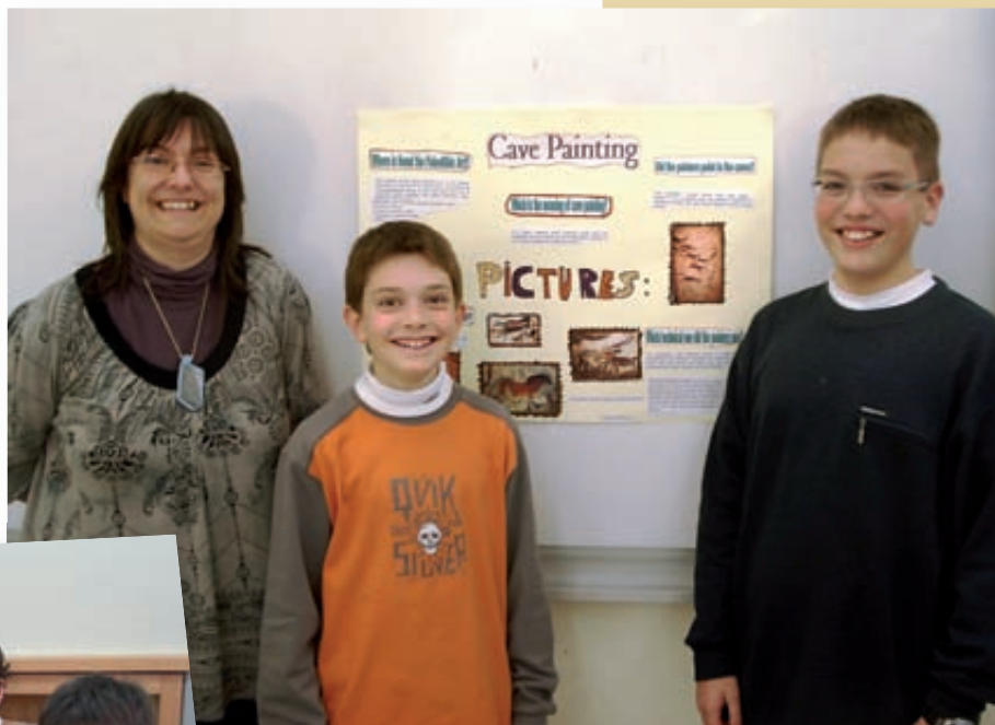
Els de 1r, aquest any han fet una part de les Socials també en anglès

De mica en mica, ens anem acostumant a fer algunes activitats en anglès a l'Escolania, a més de les classes de l'assignatura. Els més petits fan 3 sessions de jocs en anglès cada setmana. I els de cursos més grans hem mirat algunes pel·lícules en anglès. I quan dinem després de fer de servidors, tenim una educadora que només ens parla en anglès. Alguns som atrevits, i també parlem en anglès! Els escolans ens servim a taula per torns, seguint una tradició benedictina. És una manera de servir-nos els uns als altres.