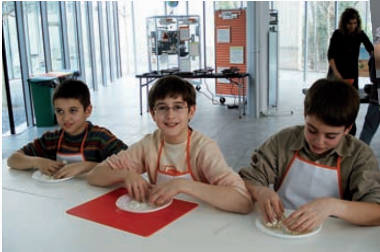
Taller de cuina medieval

Aprofitant la restauració de l'antic monestir de Sant Benet de Bages (on havien viscut monjos de Montserrat fa molts anys) vam fer una excursió de l'escola, i ens ho vam passar la mar de bé! La visita guiada al monestir va ser una passada, amb unes projeccions que et transportaven a la història d'aquest lloc i també a la història de Catalunya.