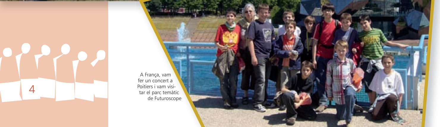
A França, vam fer un concert a Poitiers i vam visitar el parc temàtic de Futuroscope