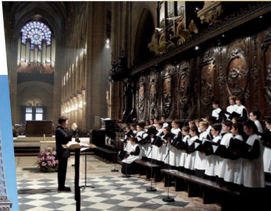
A Notre-Dame hi vam cantar dues vegades. Impressionant!