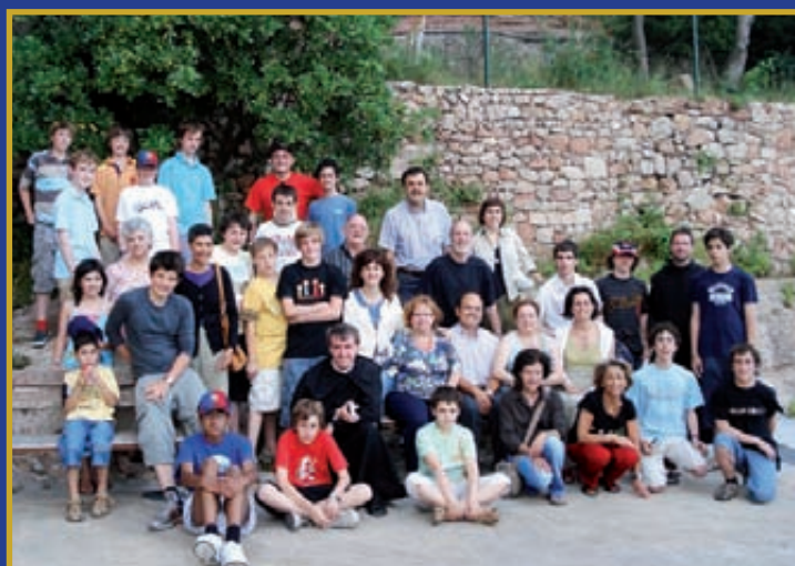
Comiat de les famílies dels escolans i els anglesos a Montserrat