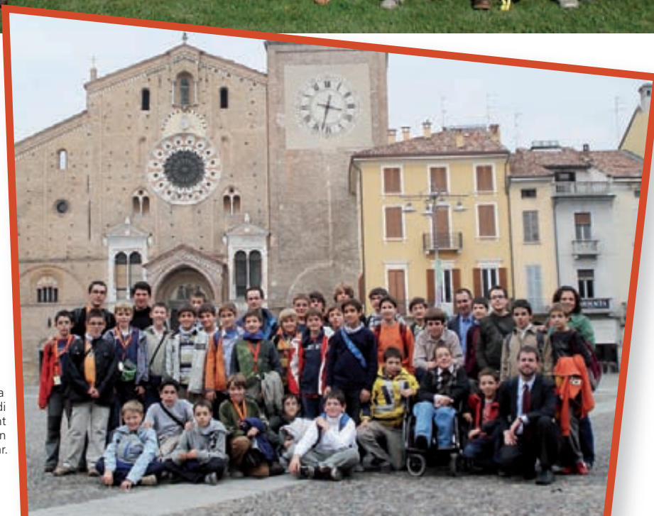
A la plaça major de Lodi (Itàlia), davant la Catedral on vam cantar.