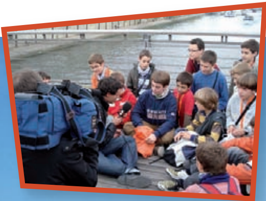
Els de TV3 ens van fer un reportatge sobre aquesta experiència.

A l'octubre, una altra gira!! Vam començar cantant a Cuixà, vam continuar a París i vam acabar a Lodi, molt a prop de Milà! Ens ho vam passar molt bé!!!