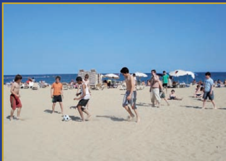
Jugant a futbol a la platja de Barcelona