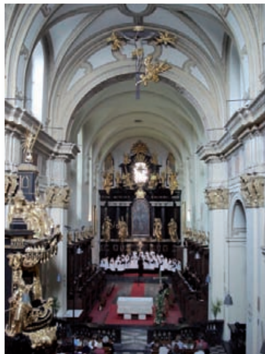
Concert a Tyniec