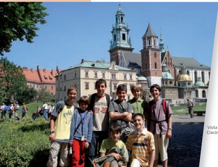
Visita a Cracòvia

El mes de juny vam fer una gira per dos països, i vam anar a Polònia per primera vegada!