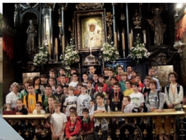
Al santuari marià de Czestochowa, on vam cantar