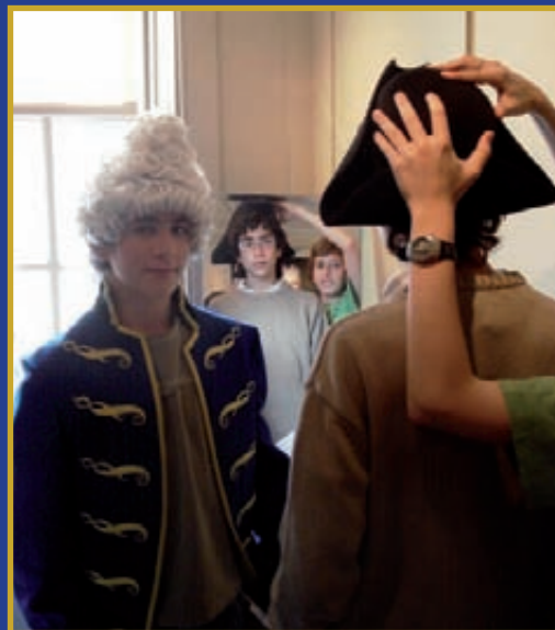
Amb vestits d'època, a la casa de Händel

A final de curs, els escolans grans van fer l'intercanvi amb nois de Londres. Primer, vam estar uns dies a Anglaterra. I després, ells van venir a Catalunya. Uns dies inoblidables!