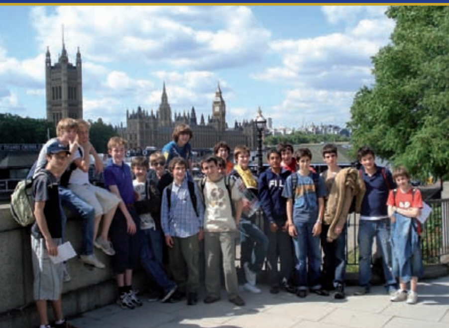
Catalans i anglesos, junts davant del Big Ben i les Houses of Parliament

A final de curs, els escolans grans van fer l'intercanvi amb nois de Londres. Primer, vam estar uns dies a Anglaterra. I després, ells van venir a Catalunya. Uns dies inoblidables!