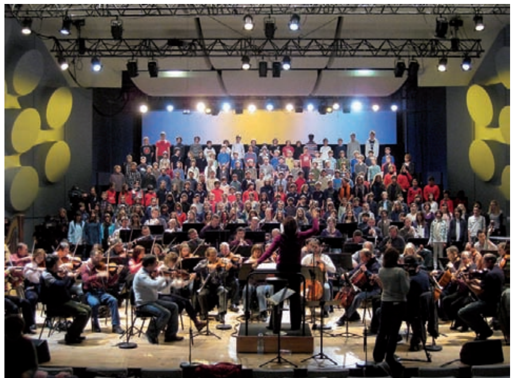
Assaig pel concert d'Estrasburg

El mes de desembre, els de 5è van anar a cantar a la cloenda de la presidència francesa de la Unió Europea. Van actuar a Estrasburg junt amb nois i noies d'altres països d'Europa.