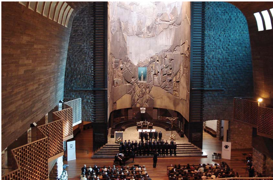
Concert a la basílica d'Arantzazu

Aquest novembre hem anat a fer una gira al País Basc! Hem participat en una trobada de cors titulada "Encontre entre cultures", amb la participació de la Escolanía de El Escorial (Madrid), l'EASO Escolania de Donostia, i la nostra Escolania. I vam fer dos concerts: a Donostia-Sant Sebastià, i al Santuari d'Arantzazu.