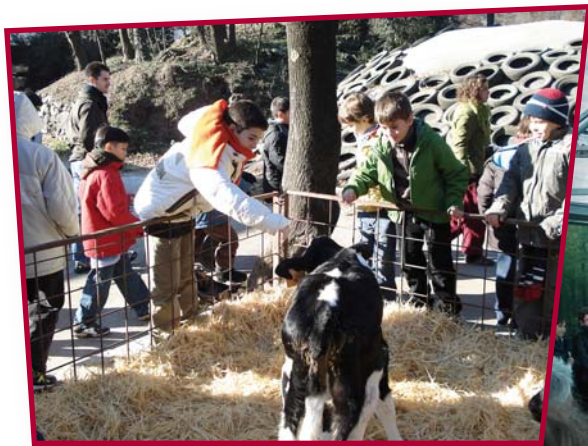
A La Fageda ens van ensenyar tot el procés d'elaboració dels iogurts