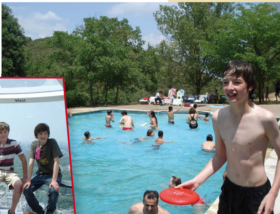
A Montserrat els vam convidar a compartir un dia a la piscina, amb les nostres famílies