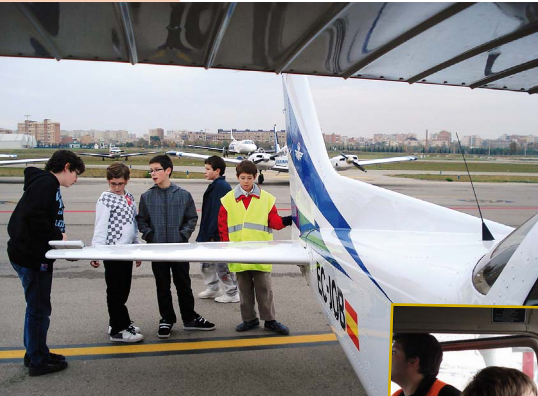
Visita a l'Aeroport de Sabadell

Quan fem concerts, quasi sempre intentem aprofitar l'oportunitat per visitar llocs interessants, tant si els fem a Catalunya com si els fem en altres països. Aquí teniu algun exemple d'aquests darrers mesos.