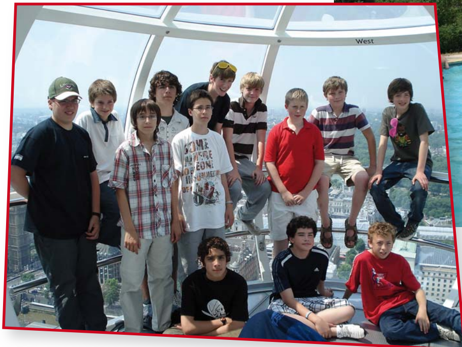
Viatjant amb el London Eye, des del qual tens una vista meravellosa del Big Ben i d'una gran part de Londres

Un any més hem fet l'intercanvi dels escolars grans amb els nois de Saint Benedict's School, del barri d'Ealing (Londres). Una experiència ben enriquidora per a tots!