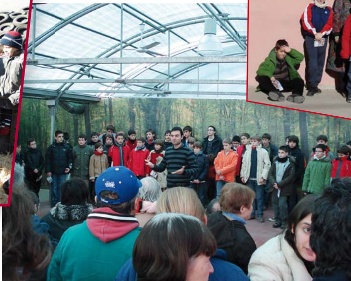
Vam acabar cantant unes cançons per als treballadors de La Fageda