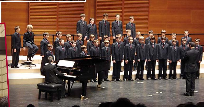
Concert a l'Auditori del Kursaal de Donostia