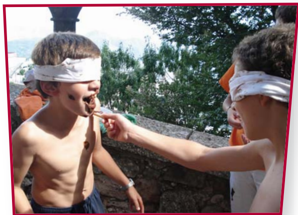
Una prova de la gim-khana organitzada pels escolans grans

Al final d'agost van venir a viure uns dies amb nosaltres dos nois anglesos. Amb ells vam aprendre rugbi, i ens ho vam passar molt bé! Eren molt simpàtics!