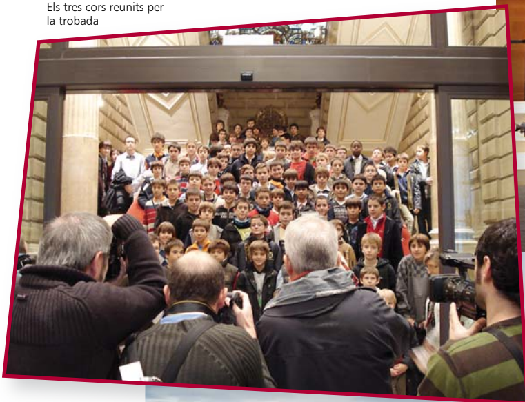
Els tres cors reunits per la trobada