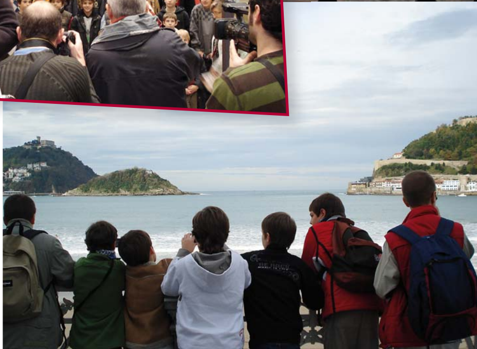
Els escolans, a la platja de La Concha de San Sebastià