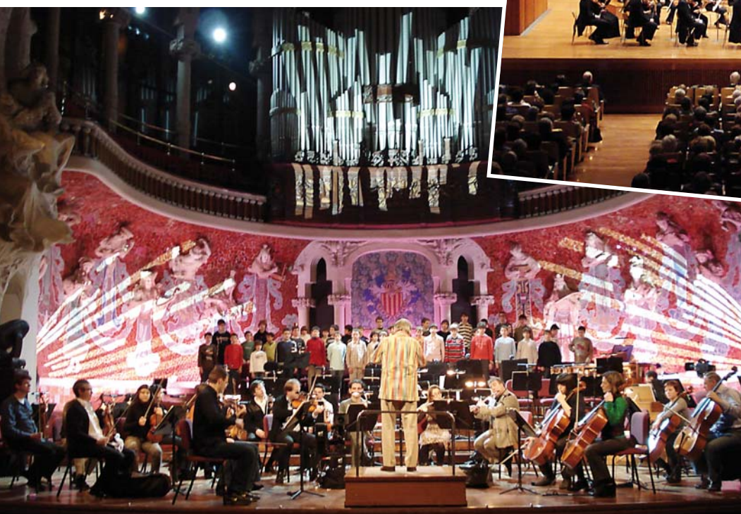
Concert al Palau de la Música Catalana