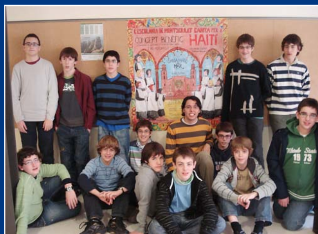
El concert per Haití va ser una activitat organitzada pels escolans grans, que aquí apareixen amb l'educador que va fer el cartell