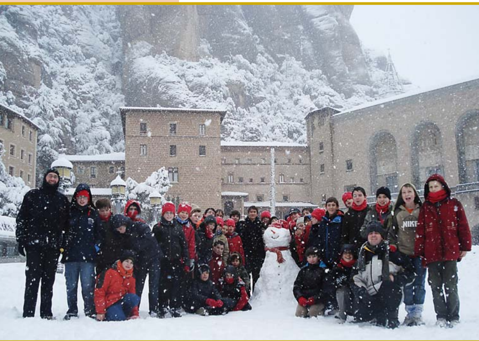
La nevada del març va ser ben aprofitada

Tots sabem que hi ha una sèrie de tòpics relacionats amb l'Escolania: que si són nens orfes, o ben al contrari, que si són nens de famílies molt riques... que si són futurs monjos, que si no van mai a casa seva, etc. La pregunta subjacent és si són nens normals.