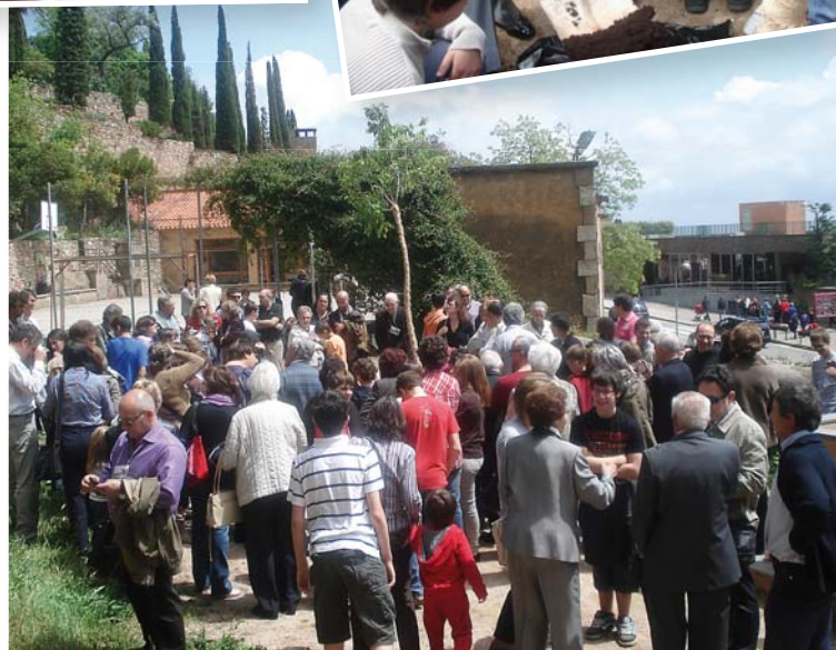
Al mig del Pati de la Figuera, els avis i àvies van plantar un arbre en record de la festa