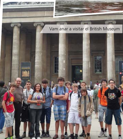
Vam anar a visitar el British Museum