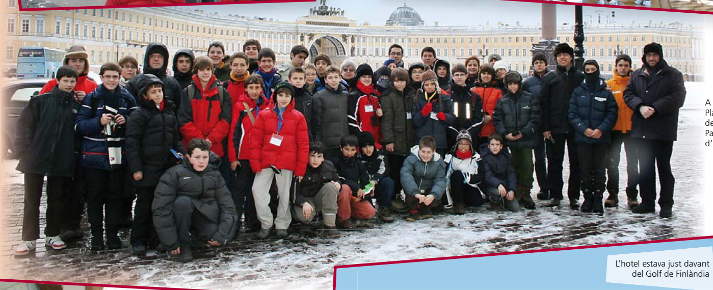
A la Plaça del Palau d'Hivern