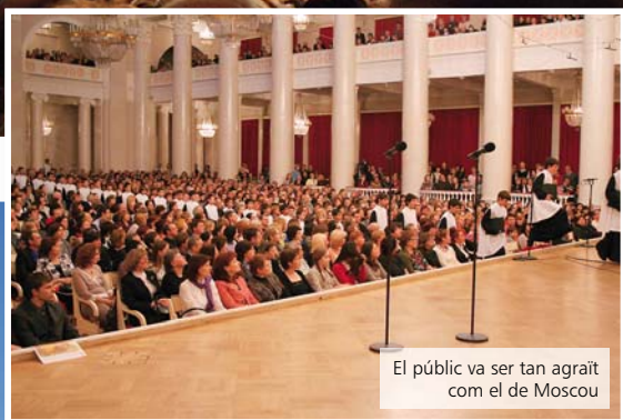
El públic va ser tan agraït com el de Moscou