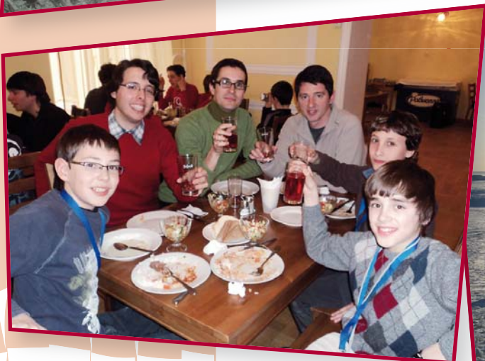
A punt de provar el suc de cirera!