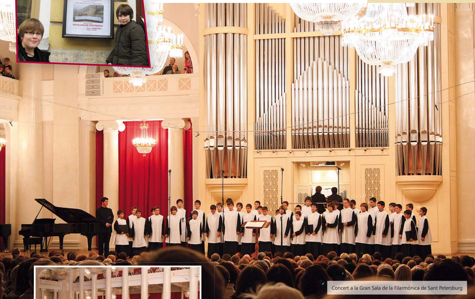
Concert a la Gran Sala de la Filarmònica de Sant Petersburg