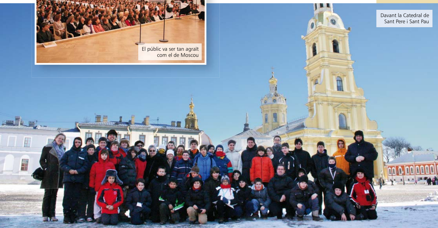
Davant la Catedral de Sant Pere i Sant Pau