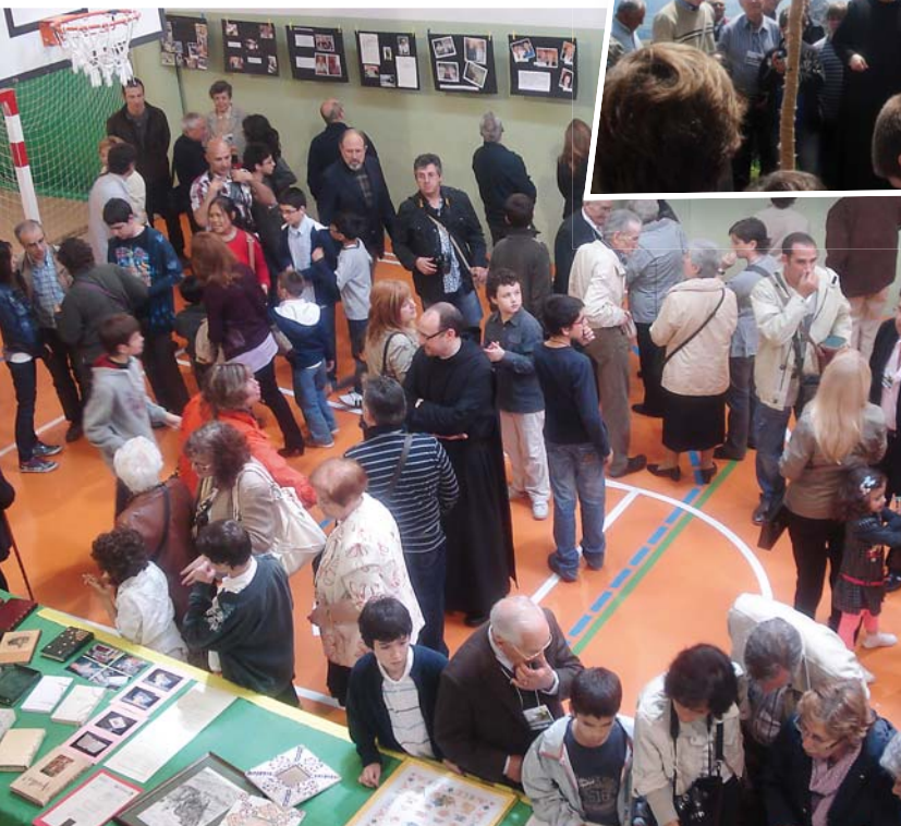
Al poliesportiu hi va haver una llarga exposició amb un cartell de cada família: fotos de la vida dels avis, i una frase de cada escola sobre els nostres avis. A l'altra banda, una altra exposició amb moltes manualitats fetes pels avis

Per segona vegada, hem tornat a celebrar un dia festiu dedicat als nostres avis i àvies! Va ser molt entranyable i amb molta participació de tots.