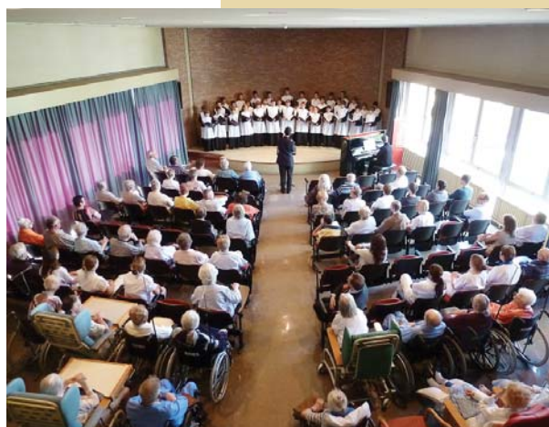
Vam fer un concert benèfic a l'hospital Jan Palfijn