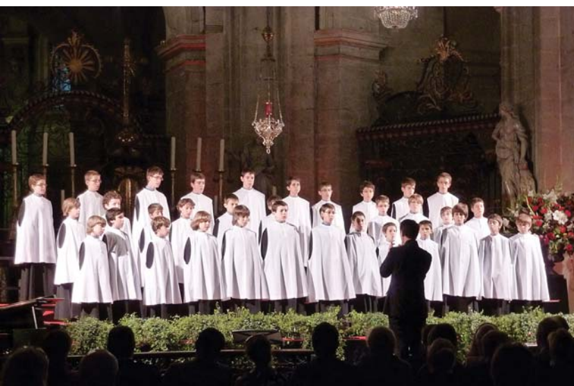
Concert a St. Pieterskerk, de Ghent: una església molt gran, on van afegir moltes grades al final. Espectacular

Durant el primer trimestre d'aquest curs vam fer dues gires en una: primer Flandes, i després Alemanya! Una setmana molt intensa i emocionant.