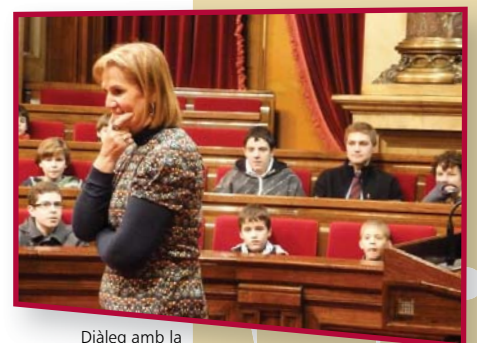
Diàleg amb la Presidenta del Parlament