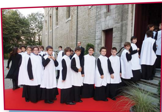
L'entrada al concert semblava de Hollywood!