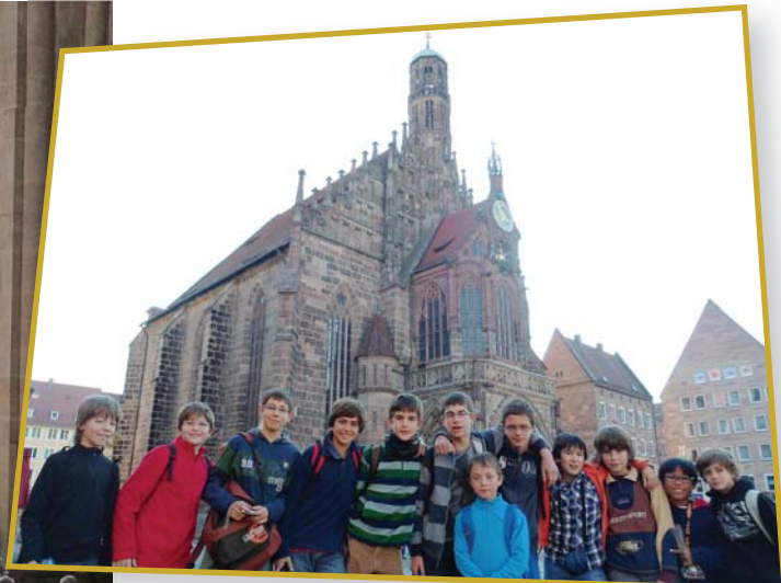
Davant l'església de Nüremberg on vam fer l'últim concert