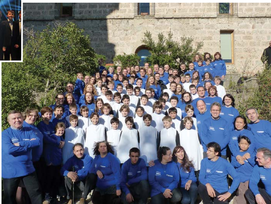
Els pares i mares es van fer la samarreta de La Marató i van acompanyar els fills amb molta alegria