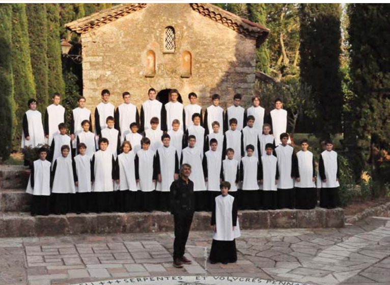
Durant l'enregistrament del videoclip de La Marató