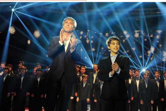
L'actuació a TV3 amb Sergio Dalma