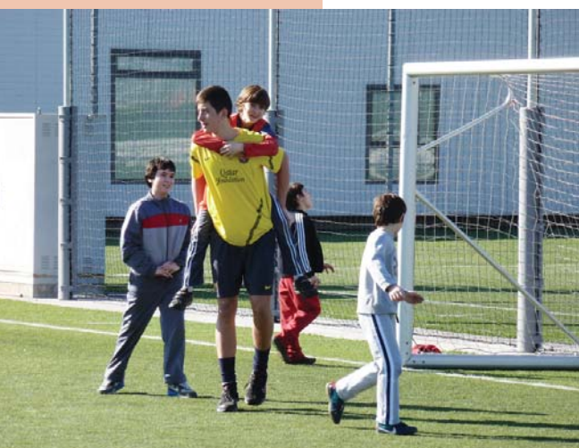
Intercanvi amb la Masia del FCBarcelona