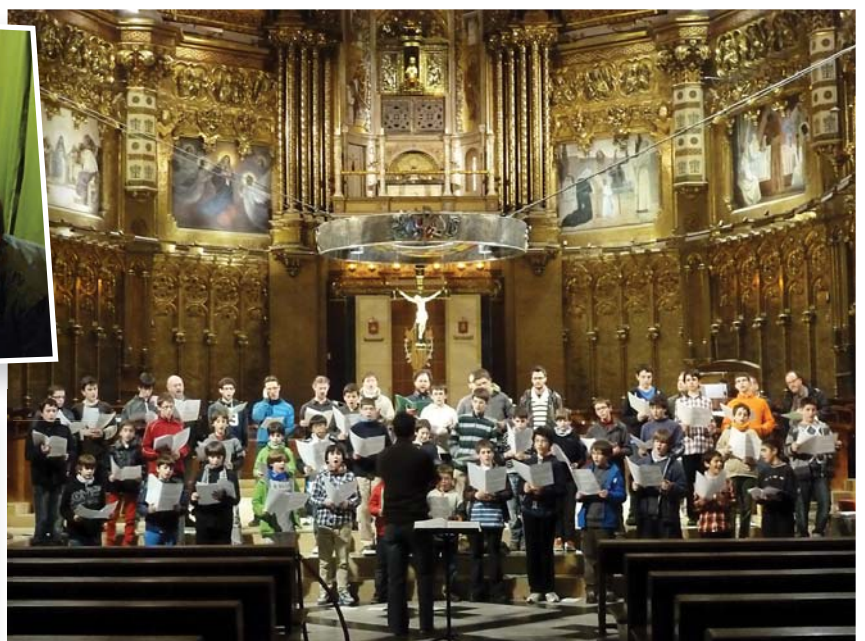
Aquí ens podeu veure cantant amb la Capella de Música de Montserrat