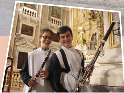
Vam aprofitar per visitar la Catedral de Maguelone, molt a prop del mar