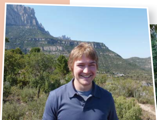
L'Andrew va conivir amb els escolans parlant-los només en anglès

Dintre la formació de seguretat, hi va haver una demostració del funcionament dels extintors