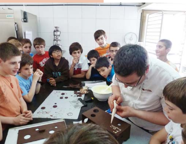
Visita a un xocolater de Taradell

A la portada d'aquest número parlem de nous horitzons. Ens referim a horitzons que ens vam fixar fa uns anys, i que progressivament han esdevingut realitats en el dia a dia de l'Escolania. Però continuem apuntant cap a aquests horitzons, perquè sempre es poden fer nous passos que ens portin més lluny. Posem-ne un exemple: la potenciació de l'anglès a l'Escolania. La realitat d'avui, que s'ha anat gestant els darrers anys, és que tenim Gap Students convivint amb els escolans. Són nois de parla anglesa que, durant el seu any previ a la Universitat, s'agafen un any sabàtic (el Gap Year) per fer noves experiències. I hem contactat amb diferents escoles d'Anglaterra i Estats Units per poder oferir aquesta possibilitat als seus estudiants. Aquests nois organitzen l'activitat esportiva per als escolans, i comparteixen amb ells les estones de lleure cada dia. No cal dir que això ens està ajudant, i molt, a pujar el nivell d'anglès.