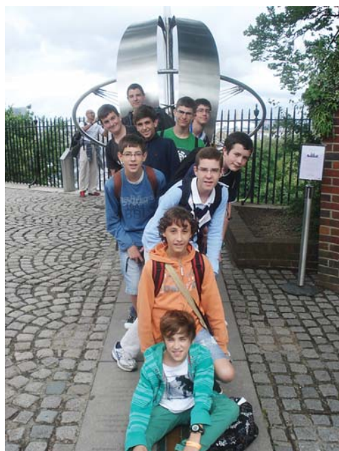
Al Meridià de Greenwich

Des de fa uns anys, ja és típic que els més grans acabem amb un viatge a Anglaterra, tot fent un intercanvi amb nois d'una escola de Londres.