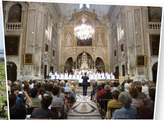
Concert a Notre Dame des Tables, Montpeller