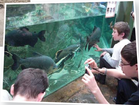
Visita a la Serre Amazonienne, que representa el medi ambient de la selva amazònica