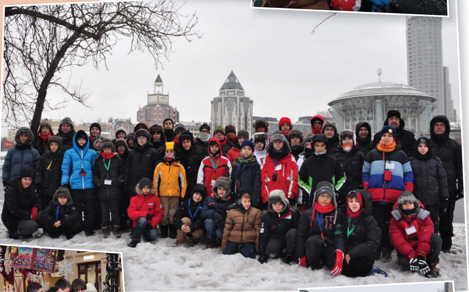
Tot el grup davant la Moscow International Performing Arts Centre, on vam actuar