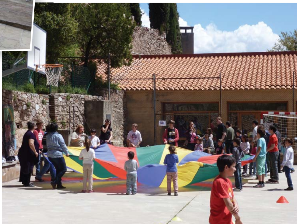
Aquest darrer curs vam celebrar la Festa dels Cosins a l'Escolania