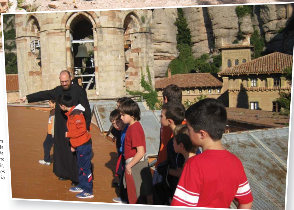
El G. Efreu ens ensenya als escolans més petits els secrets del monestir, que té segles d'història