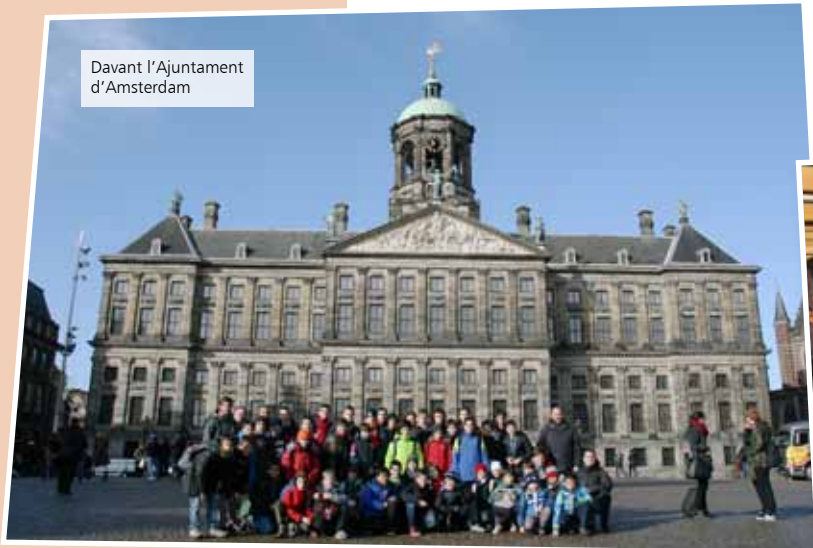
Davant l'Ajuntament d'Amsterdam

Com que en el trajecte entre Barcelona i Beijing teníem una escala llarga a Amsterdam, vam aprofitar-ho per visitar la ciutat i fer un viatge amb barca pels canals.