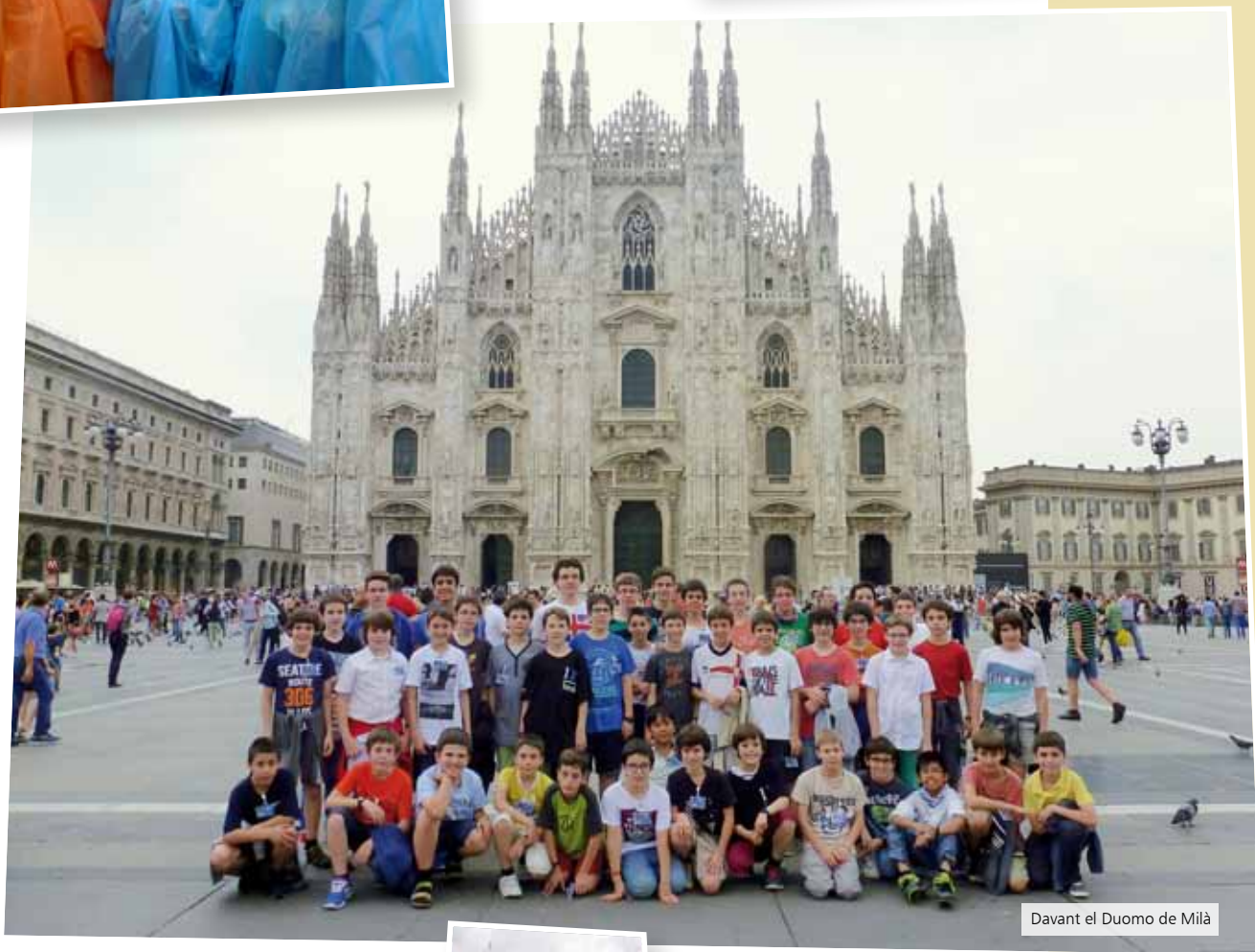
Davant el Duomo de Milà

Ens van fer una visita guiada a la Galeria dels Uffizi, a Florència, on vam poder veure quadres molt famosos i bonics. Aquí ens estan explicant "El naixement de Venus", de Botticelli