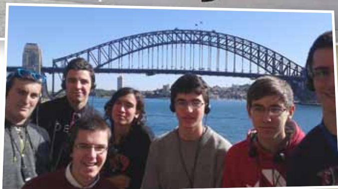
Davant el pont del Port de Sydney