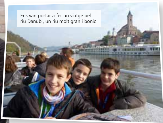
Ens van portar a fer un viatge pel riu Danubi, un riu molt gran i bonic

Dormir amb els companys en un altre país sempre és una cosa emocionant