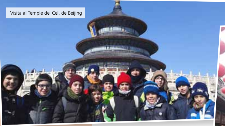
Visita al Temple del Cel, de Beijing