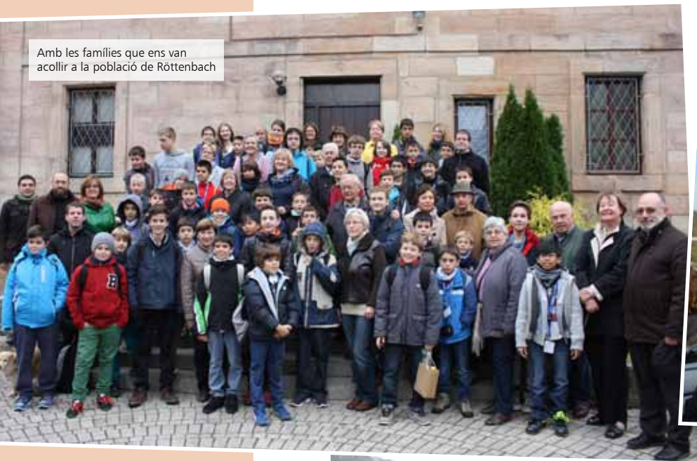
Amb les famílies que ens van acollir a la població de Röttenbach

Alemanya és un dels països en els quals l'Escolania desperta més interès des de fa anys. Aquest curs ens van convidar a cantar a Röttenbach i a Passau, a Baviera.