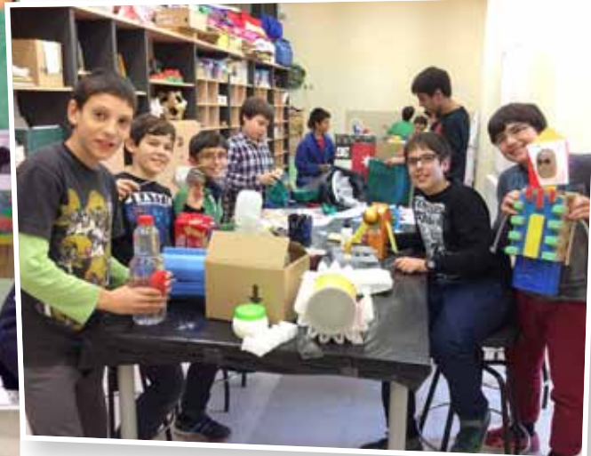
Construcció de robots amb material reciclat