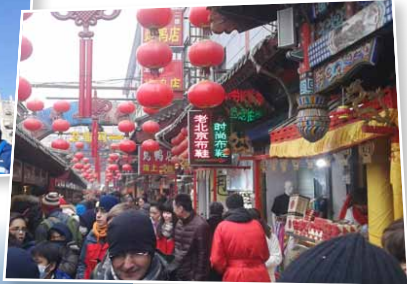
Vam passejar per un típic mercat xinès, amb productes molt exòtics per nosaltres