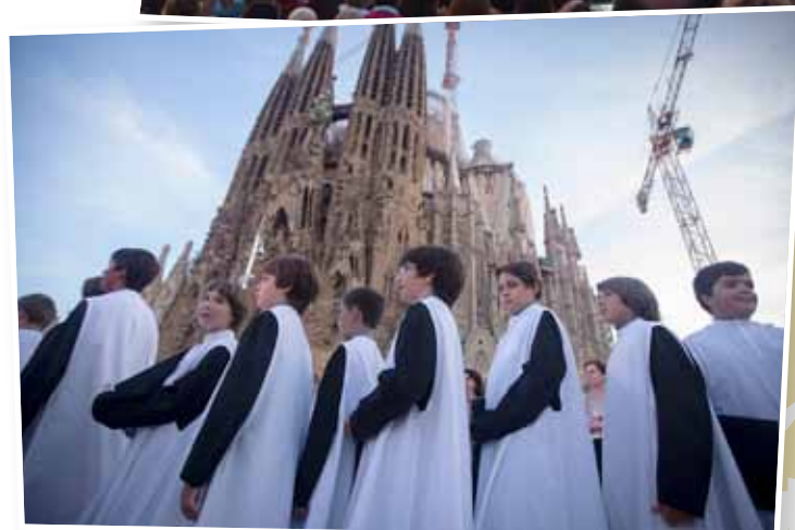
Amb motiu dels actes del Tricentenari del 1714, vam participar en un concert a l'aire lliure davant la Sagrada Família de Barcelona