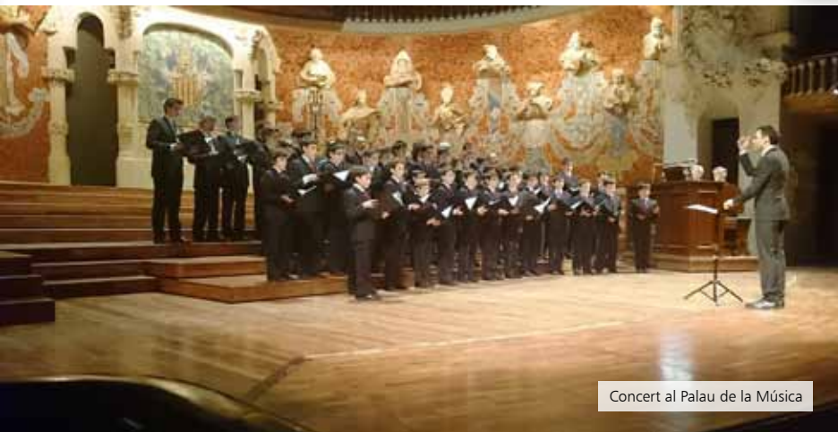
Concert al Palau de la Música