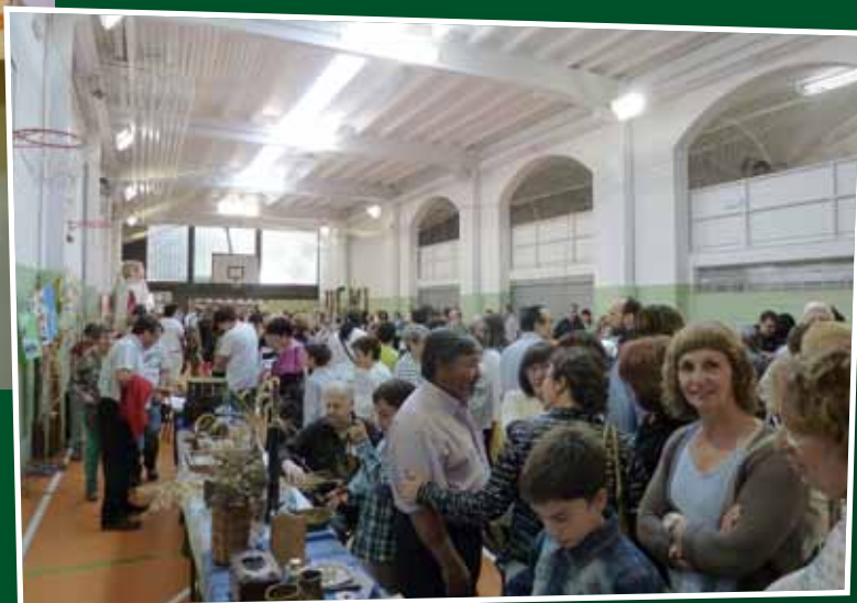
Exposició de tota mena d'artesanía feta pels avis