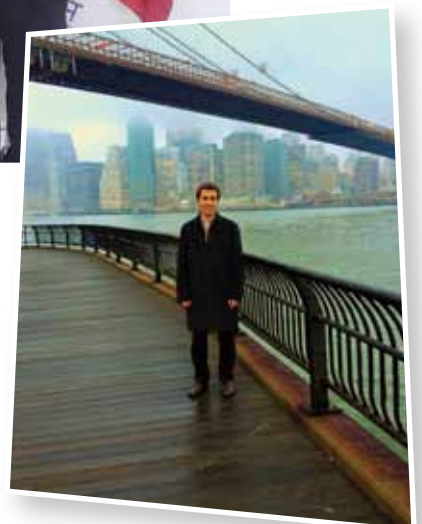
Una de les possibilitats que s'ofereixen als antics escolans joves és fer una estada en una escolania de Nova York