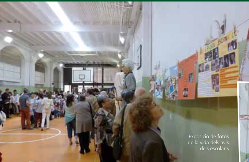
Exposició de fotos de la vida dels avis dels escolans

La festa dels avis és una celebració de les més especials que viu l'Escolania. Aquesta vegada, va ser el dia que vam estrenar el gegantó Nicolau que han fet els pares dels escolans. Els padrins van ser en Marc, un gegantó de Montblanc que és un escolà i la Temporal, una gegantona d'Avià que és una àvia! I al final, fins i tot vam fer una cercavila pel carrer. Un dia inoblidable per totes les famílies.