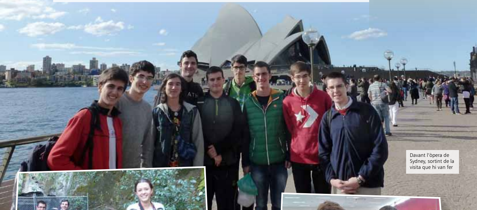
Davant l'òpera de Sydney, sortint de la visita que hi van fer

Els Antics Escolans joves estan molt actius! Aquí teniu el primer grup que ha estat acollit per una escola benedictina de Sydney, i el noi que ha fet una estada d'uns mesos en una escolania de Nova York.