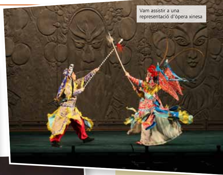
Vam assistir a una representació d'òpera xinesa