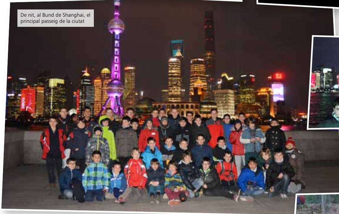
De nit, al Bund de Shanghai, el principal passeig de la ciutat