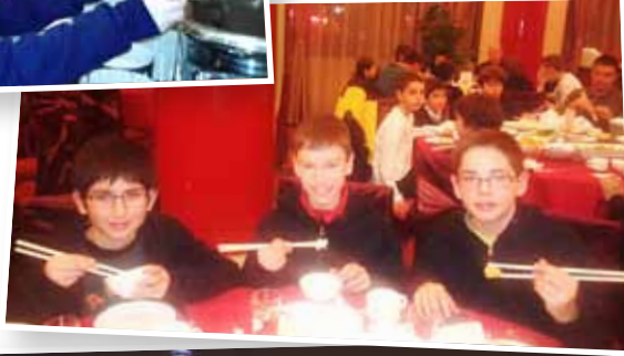
Vam aprendre a menjar amb els bastonets, és només qüestió d'agafar la pràctica