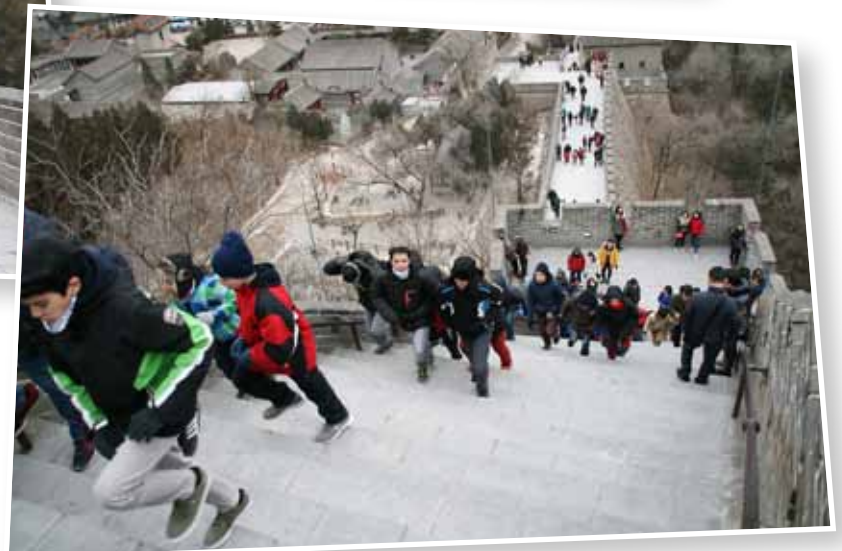
Pujant per un tros de la Gran Muralla