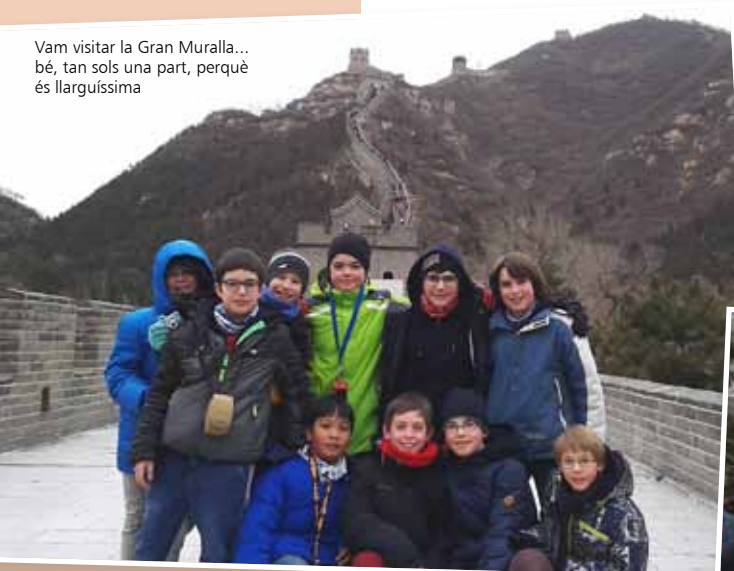
Vam visitar la Gran Muralla... bé, tan sols una part, perquè és llarguíssima