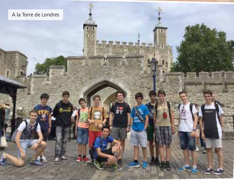
A la Torre de Londres

Cada mes de juny arriba el moment de dir adéu als escolans grans. Sempre els fem una foto de record, cada un amb el seu instrument principal, i la pengem a l'Escolania. I en acabar el curs, fan un intercanvi amb nois anglesos i visiten Londres durant uns dies.