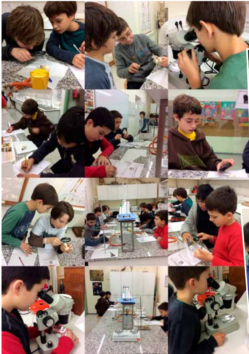
Pràctica de 5è al laboratori de l'Escolania

Més enllà de les activitats del cor, la vida de l'escola és molt intensa. A vegades, les imatges valen més que moltes paraules.