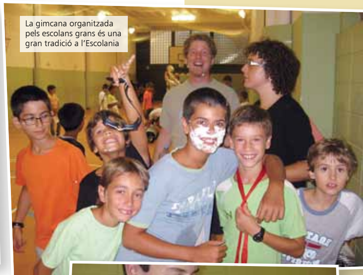
La gimcana organitzada pels escolans grans és una gran tradició a l'Escolania