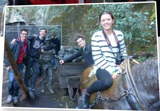
Van baixar amb un funicular que els va portar a la zona d'unes antigues mines, a les Blue Mountains