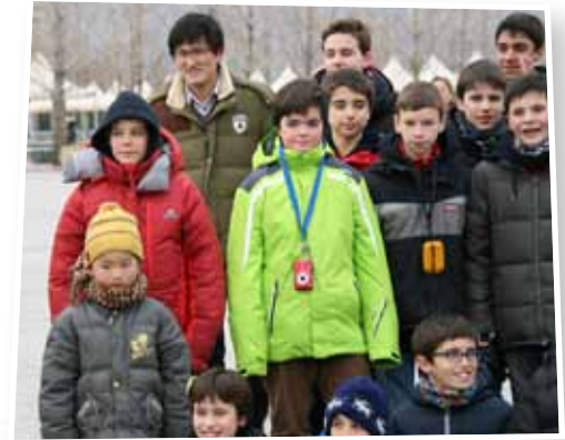
Quan ens fèiem fotos de grup, quasi sempre s'hi afegien xinesos que no coneixíem de res i que els feia molta gràcia fer-se fotos amb nosaltres. No ens havia passat mai! Va ser molt divertit