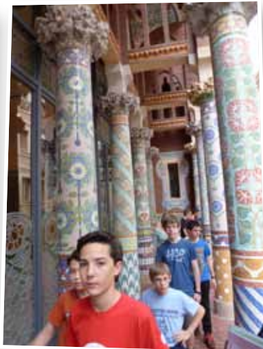
Visita al Palau de la Música