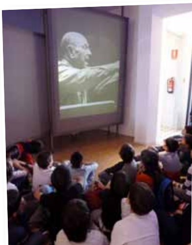
Visita a la Casa Museu de Pau Casals, al Vendrell

A l'Escolania moltes setmanes hi ha alguna cosa que les fa diferents: concerts, visites, activitats especials... aquí en teniu una petita mostra.