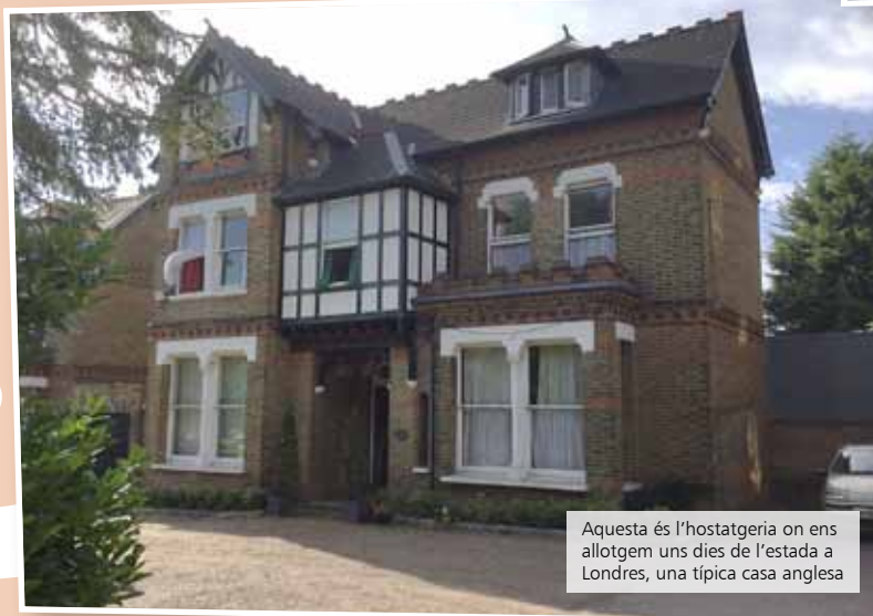
Aquesta és l'hostatgeria on ens allotgem uns dies de l'estada a Londres, una típica casa anglesa