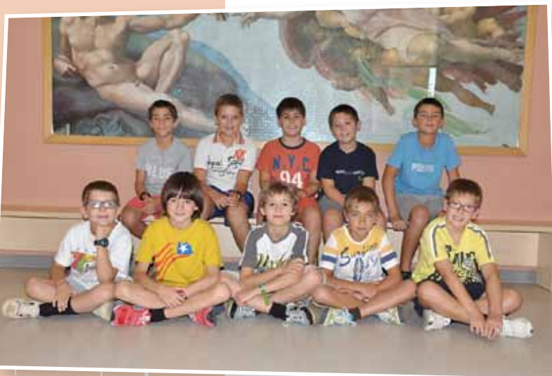
Els escolans de 4t