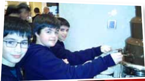
Sucant les postres en una font de xocolata. Boníssim!