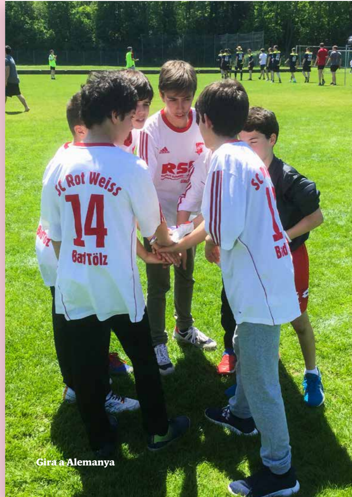
Gira a Alemanya