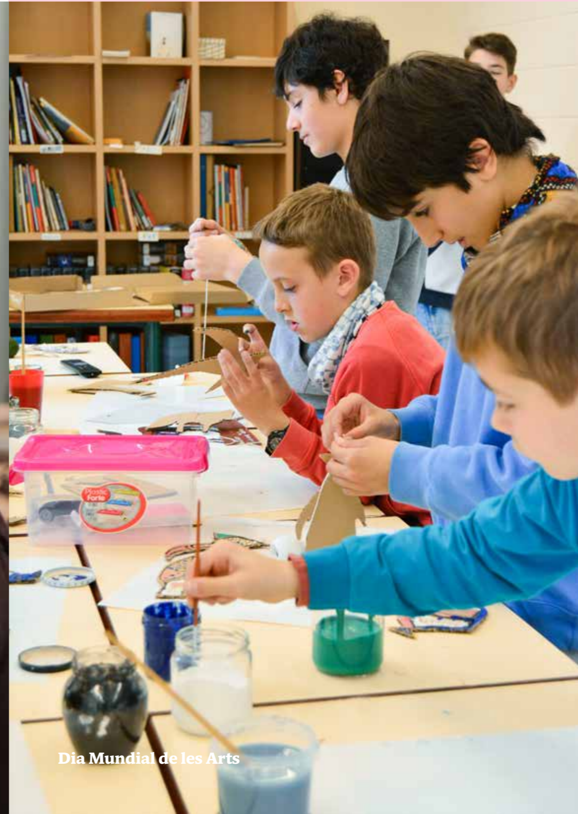
Dia Mundial de les Arts