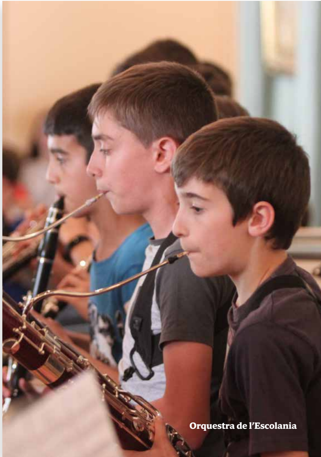
Orquestra de l'Escolania