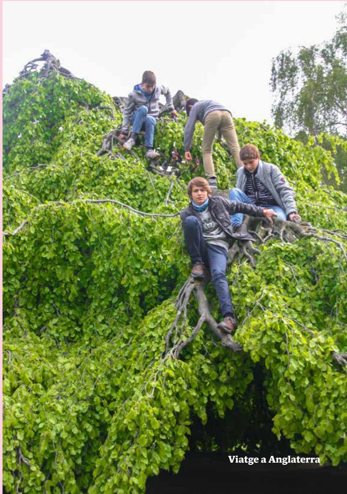
Viatge a Anglaterra