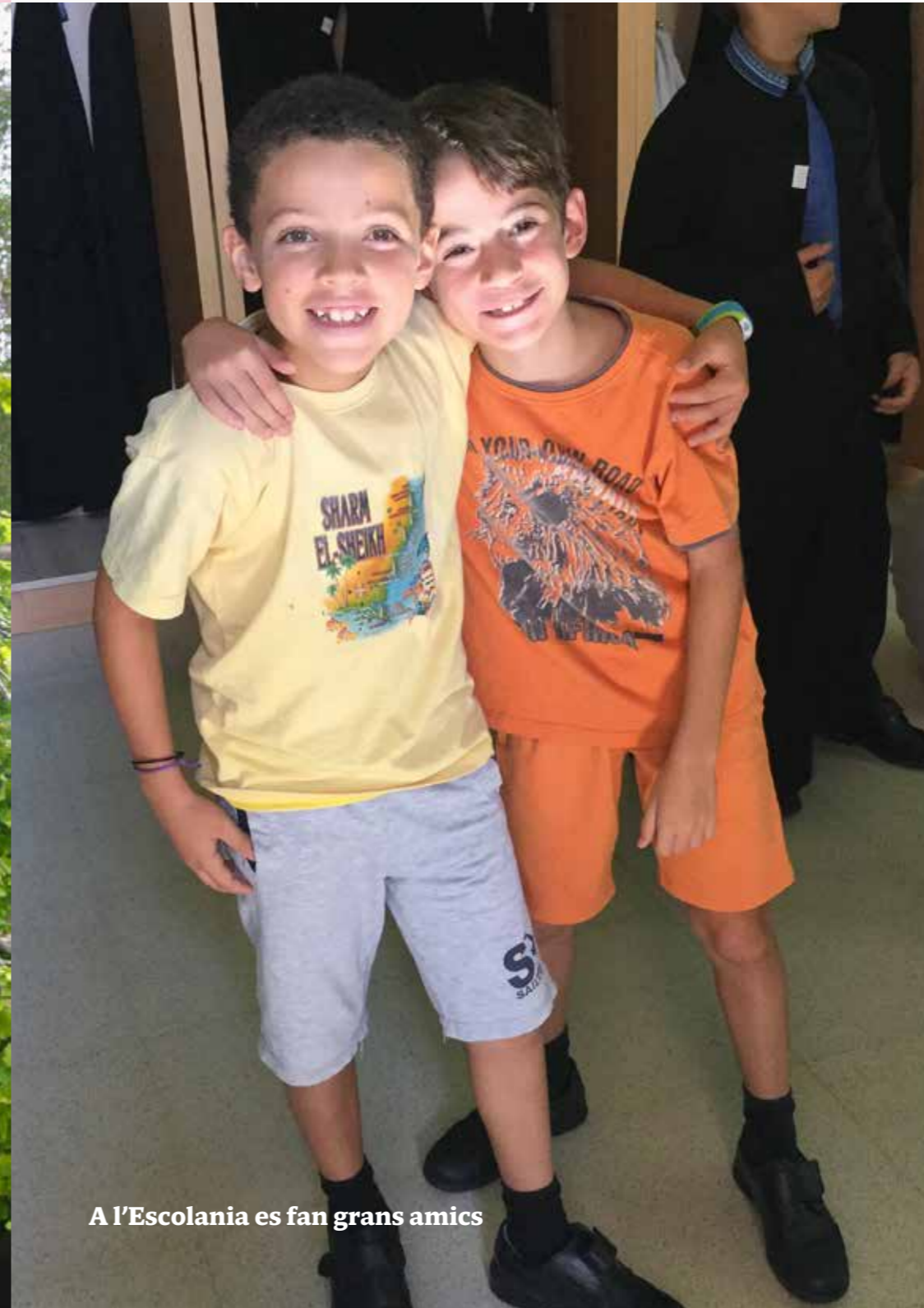
A l'Escolania es fan grans amics