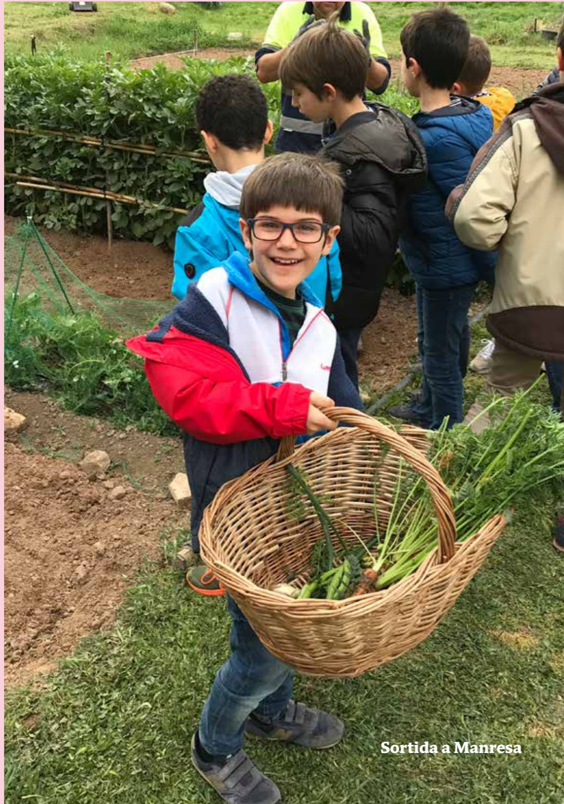
Sortida a Manresa