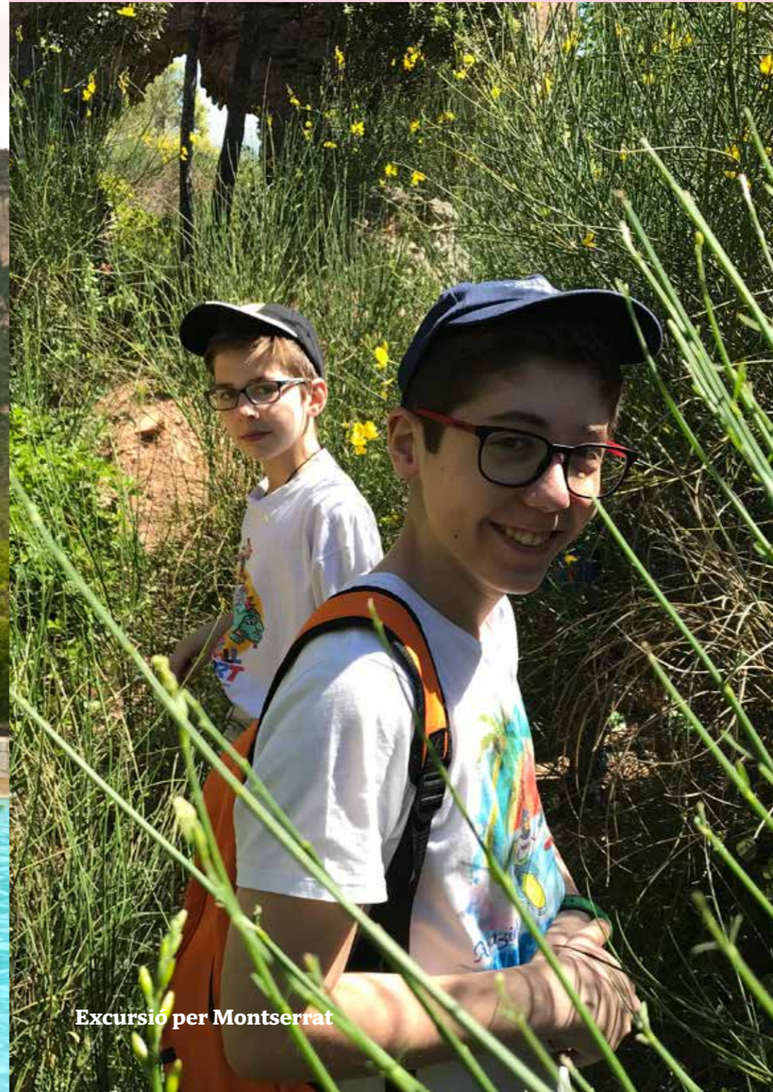
Excursió per Montserrat