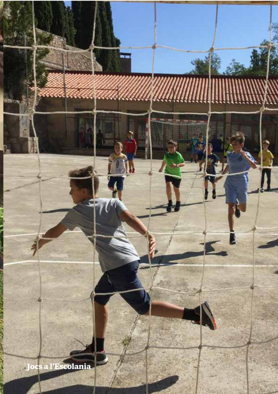
Jocs a l'Escolania