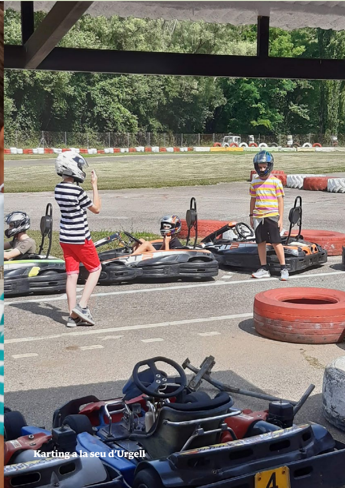
Karting a la seu d'Urgell

Producció amb orgue Per celebrar l'aniversari de l'orgue, vam fer un concert en el qual l'orgue i el cor dialogaven.