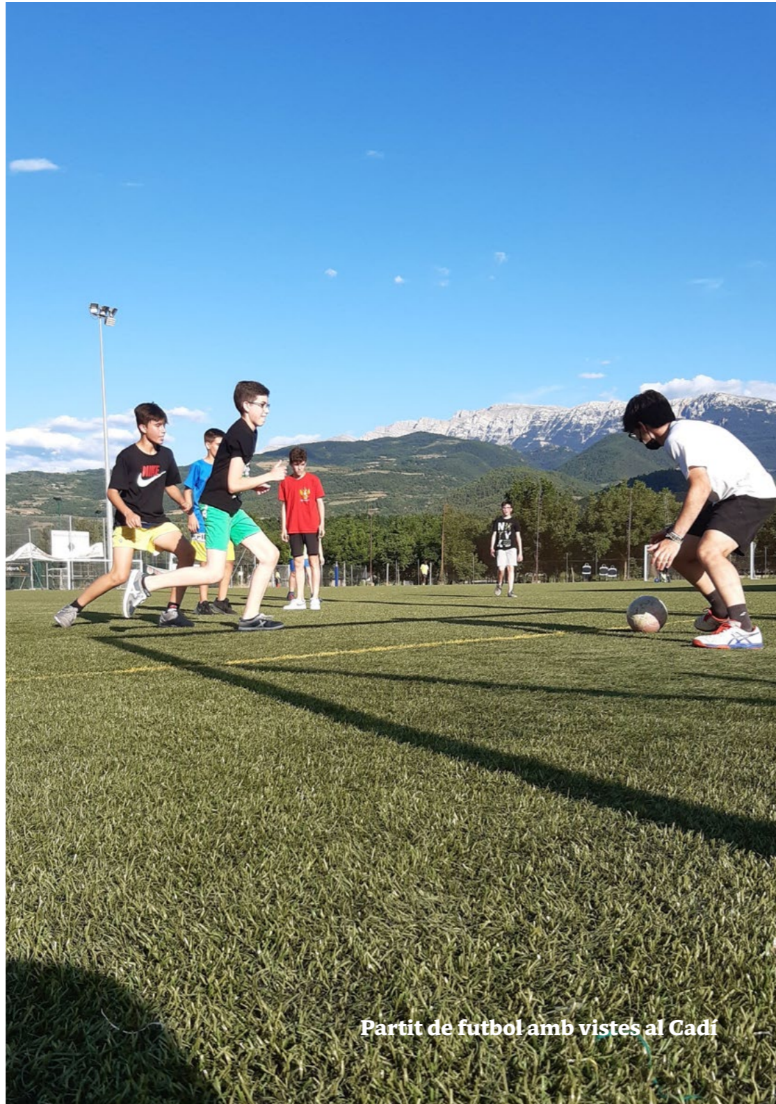
Partit de futbol amb vistes al Cadí