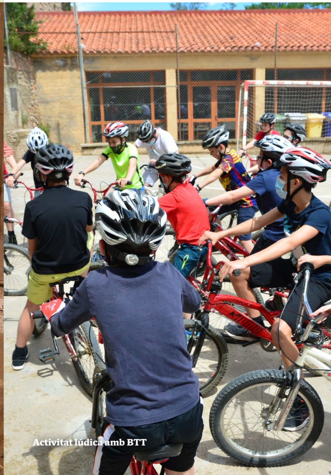
Activitat lúdica amb BTT