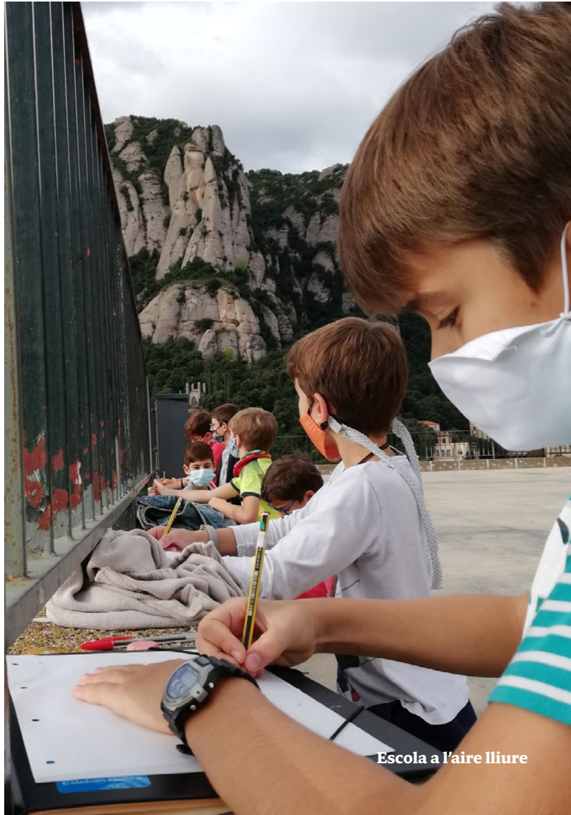
Escola a l'aire lliure