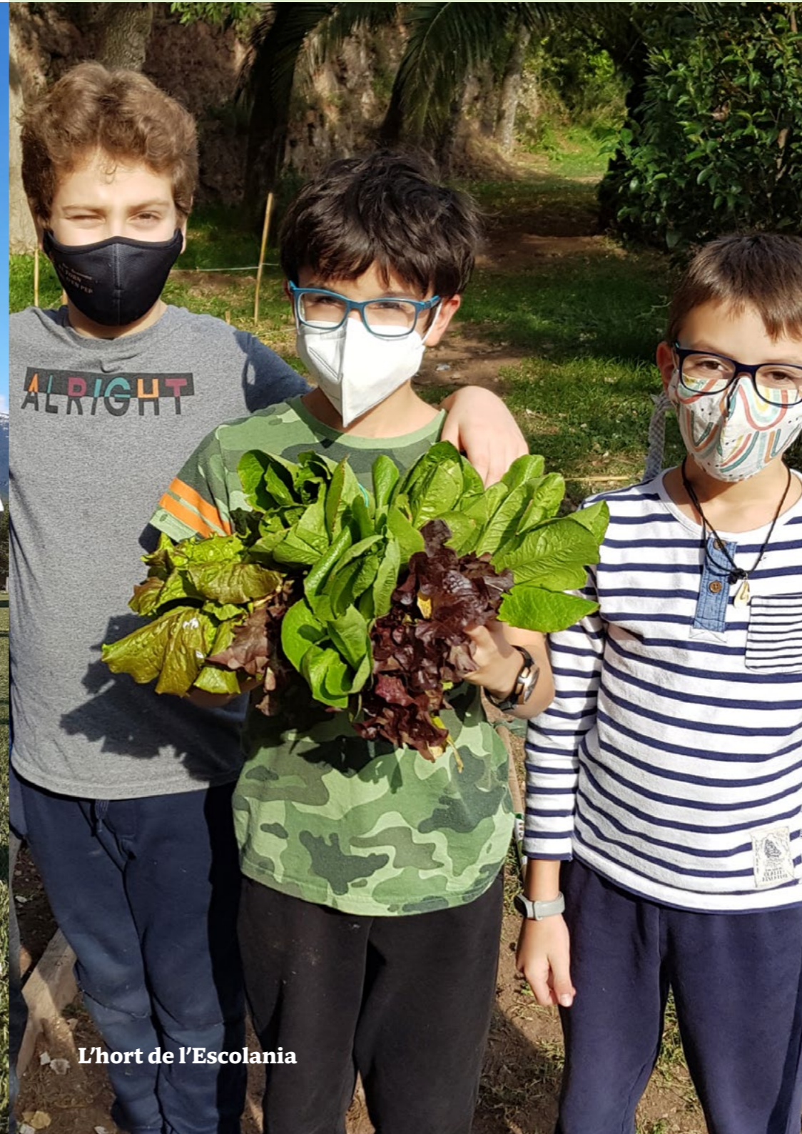
L'hort de l'Escolania

Producció amb orgue Per celebrar l'aniversari de l'orgue, vam fer un concert en el qual l'orgue i el cor dialogaven.