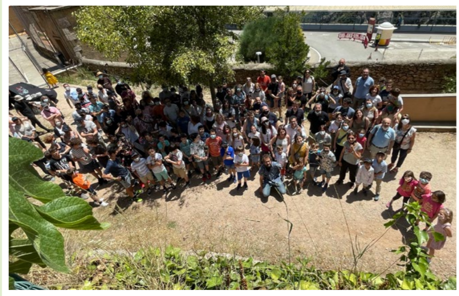
Som una gran família!