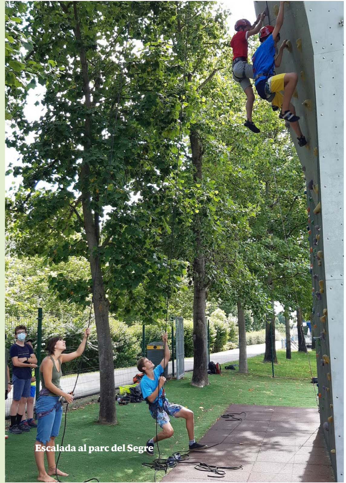
Escalada al parc del Segre

www.escolania.cat youtube.com/EscolaniaMontserrat Blog 100peus: 100peus.blogspot.com Twitter: @EscolaniaMont Instagram: escolania_montserrat Facebook: https://facebook.com/EscolaniaMont I també, escolteu-nos cada dia en directe a www.montserratcomunicació.cat