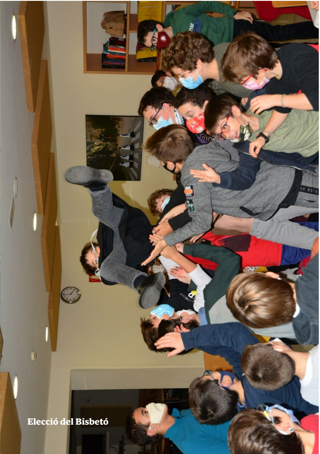
Elecció del Bisbetó