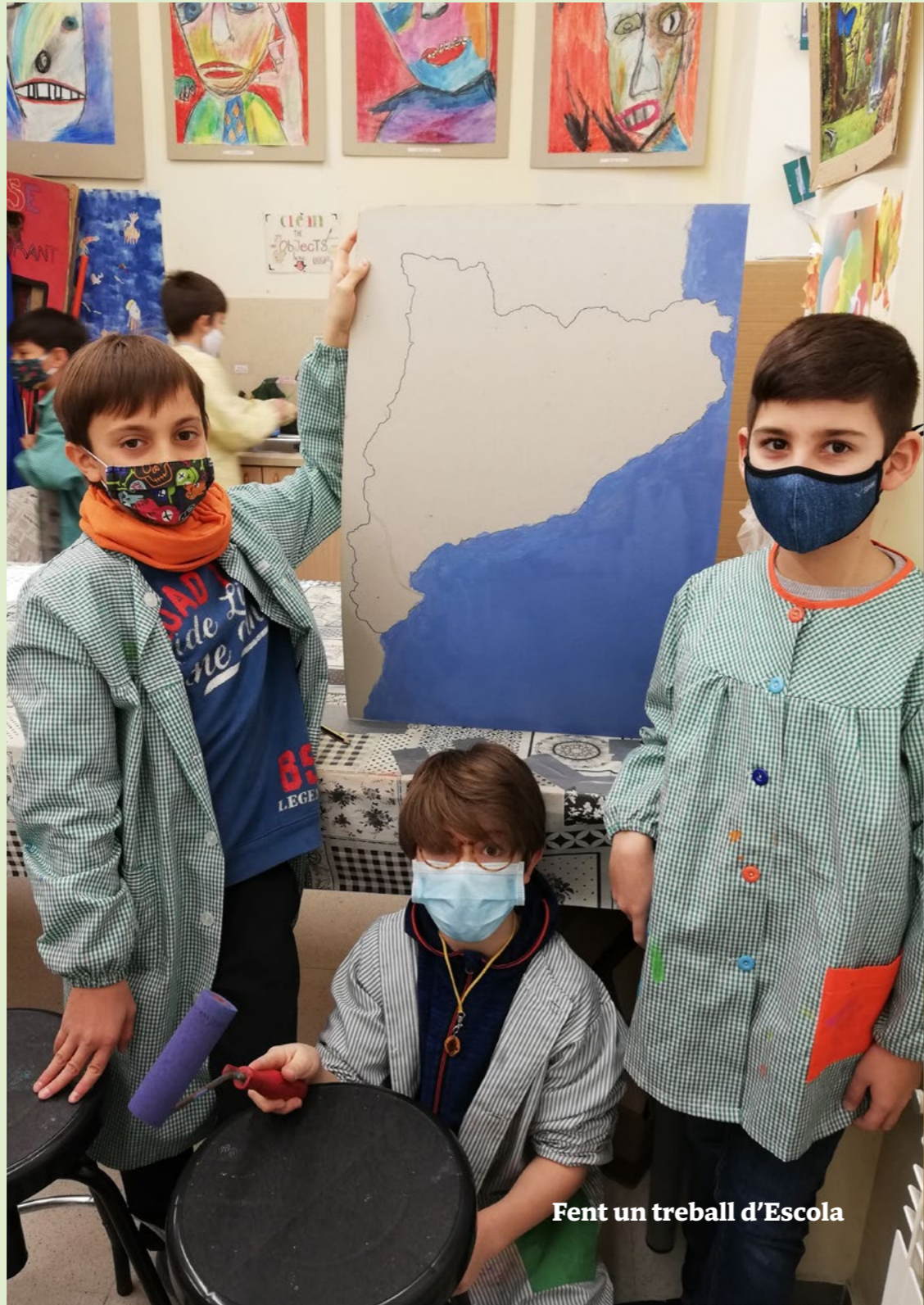
Fent un treball d'Escola