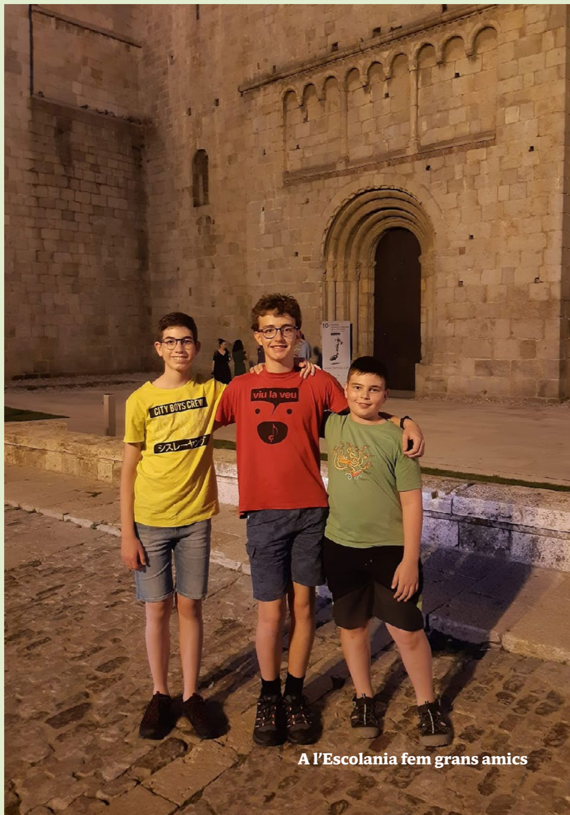
A l'Escolania fem grans amics